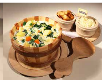
Soupe de chalet