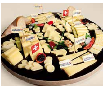
Plateau de Gruyère