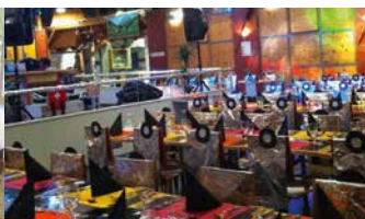
Restaurant soirée privée