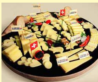
Plateau de Gruyère

Do it yourself Fondue? Group from 30 pers, in the «coin gourmand» 34.00 CHF per person