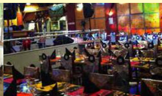
Restaurant soirée privée