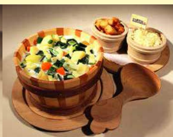
Soupe de chalet